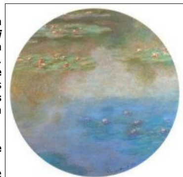
Claude Monet, Nymphéas , 1907

Un percorso lungo un secolo, illustrato da manifesti d'epoca, fotografie storiche e da una spettacolare sequenza di opere d'arte ispirate alle moto e al loro mito (fra cui spiccano artisti come Balla, Dottori, Sironi, Funi e Depero ). E poi le moto , vere protagoniste di questo evento: dai modelli storici fino quelli più attuali, per raccontare in modo inedito un secolo di storia , di cambiamenti e di evoluzione tecnologica e sociale.