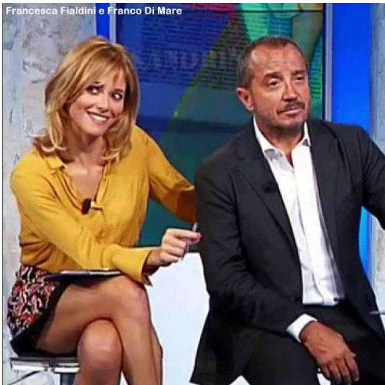
Francesca Fialdini e Franco Di Mare

Share 1725 Tweet 343 Google + 12 Email 1