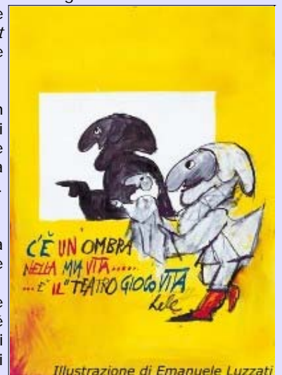
Illustrazione di Emanuele Luzzati

Luzzati si è occupato dell'illustrazione di molti libri per l'infanzia, è stato autore di testi come Tarantella di Pulcinella , I tre fratelli , ha illustrato le fiabe italiane di Italo Calvino nonché diverse filastrocche di Gianni Rodari. Ha esposto alla Biennale di Venezia, ha creato i titoli di testa de L'armata Brancaleone e Brancaleone alle Crociate di Mario Monicelli, e realizzato vari film d'animazione, tra cui La Gazza ladra e Pulcinella , che gli sono valse due nominations all'Oscar.