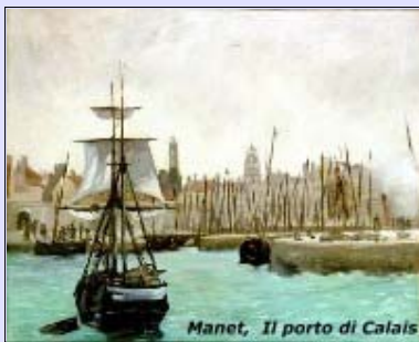
Manet, Il porto di Calais

Dai disegni di Michelangelo agli Impressionisti, passando per De Kooning, Pirandello e Luzzati. In giro per l'Italia sono diverse le rassegne artistiche da seguire. Eccone alcune.