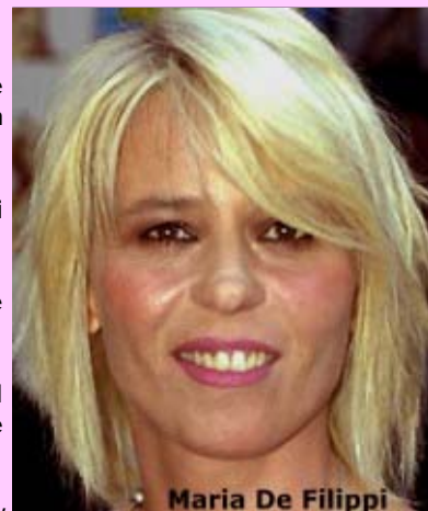
Maria De Filippi

Burrasca sulla Commissione di vigilanza Rai, a maggior ragione in un momento delicato come questo in cui i programmi di informazione dovrebbero essere in primo piano, campagna elettorale o no che sia.